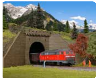
Tunnelportal mit Stützwänden Tunnel portal with retaining walls